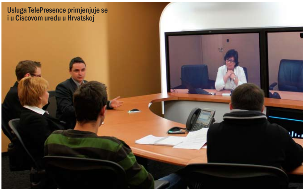
Usluga TelePresence primjenjuje se i u Ciscovom uredu u Hrvatskoj

Istraživanja potvrđuju da sustav videokonferencija pozitivno utječe na međuljudske odnose unutar organizacija, intenzivira komunikaciju između zaposlenika i nadređenih te smanjuje broj sati provedenih u uredu